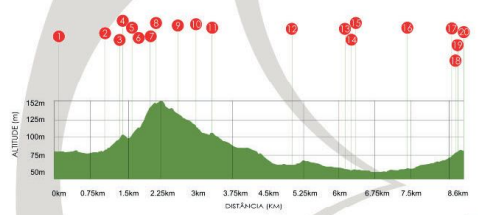
gráfico de altimetria altura/distância